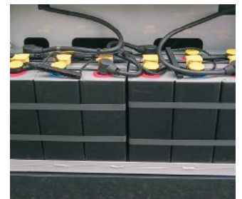
Ampio vano batterie per accogliere batterie di maggiore capacità