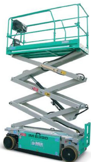
IM 6390 IM 6390 EX