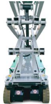
Design del carro base che permette una facile pulizia ed assicura protezione ai componenti