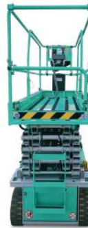
Nuovo design della PLE e della struttura forbice