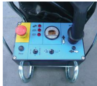
Quadro comandi sulla piattaforma semplice e intuitivo