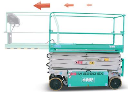
Estensione manuale piattaforma 1,3 m